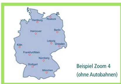
Beispiel Zoom 4 (ohne Autobahnen)

Grobe Zoomdarstellung weitere Umgebung (20 km) netto ab 180,00 Euro