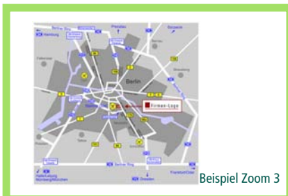
Beispiel Zoom 3

Grobe Zoomdarstellung weitere Umgebung Stadt (bis 5 km) netto 180,00 Euro