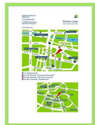
Beispiel für ein PDF (Originalgröße DIN A4) mit „einfachem Wegeplan mittel“, Zoom 2, kleiner Legende und Kontaktdaten

Grobe Zoomdarstellung Deutschland (Lage des Standorts mit wichtigsten Großstädten), ohne Verkehrsangaben: netto 10,00 Euro mit den wichtigsten Autobahnen: netto 40,00 Euro