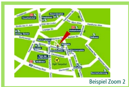
Beispiel Zoom 2

Grobe Zoomdarstellung weitere Umgebung Land (bis 10 km) netto 90,00 Euro